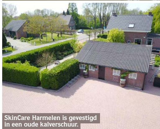
SkinCare Harmelen is gevestigd in een oude kalverschuur.